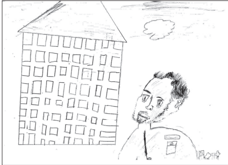
茨木支部 金田虎之助さんの作品