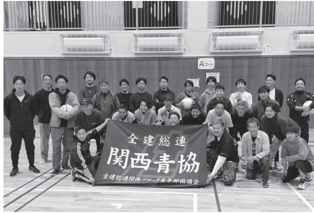
関西青協参加者のみなさん