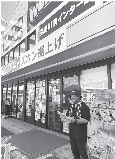
コーナンプロでチラシ配布の様子