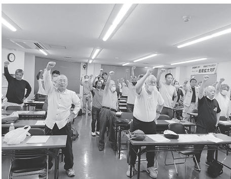
達成めざしガンバロウ三唱