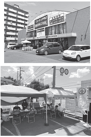
寝屋川支部拡大の様子 (コーナンプロ・寝屋川南インター店)