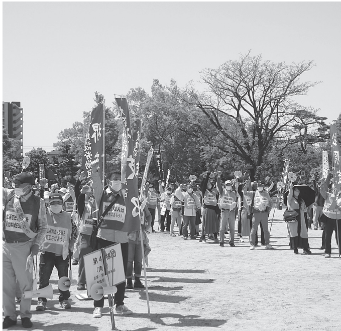
341人の仲間が「ガバロウ」で 意気上げる