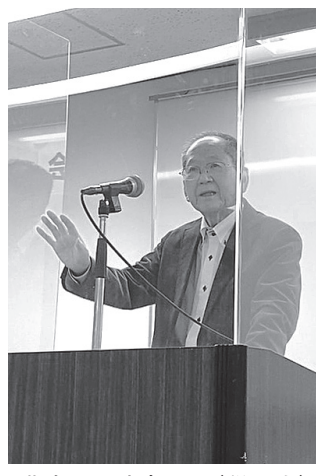
講演する清家さん(税理士)