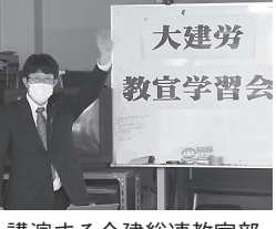
大建労 教宣学習会

川口副委員長から「インボイス制度導入予定の十月までまだ日にはある。本部としても今後地元の国会議員に直接要請して、できる限りの運動を続けていきたい。」と結び、閉会となりました。