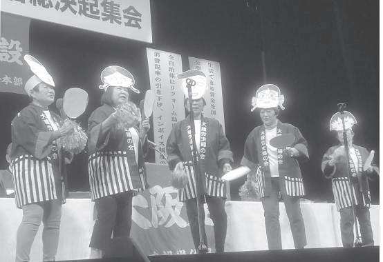
壇上の役員も巻き込み会場を盛り上げた主婦の会