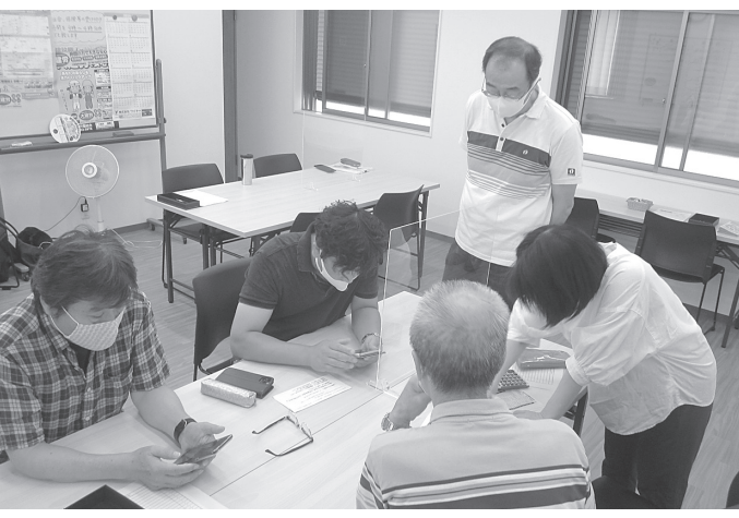
持続化給付金の申請サポート会も開催しました

大阪建設労働組合(たいけんろう)は建設現場で働くみなさんのための組合です。 全国で62万人以上、大阪で1万2千人の仲間が加入している、建設労働者のいちご暮らしを守る、一人でも入れる労働組合です。 組合員を増やし、地域や自治体への影響力を強めることによって、仕事や暮らしをよくする制度、政策などを実現することが出来ます。 春秋には仲間を増やす組織拡大月間に取り組んでいます。 あなたの身近な建設現場で働く組合未加入の方々に、ぜひ「たいけんろう」の存在を伝えてあげてください。 ご協力をお願いします。