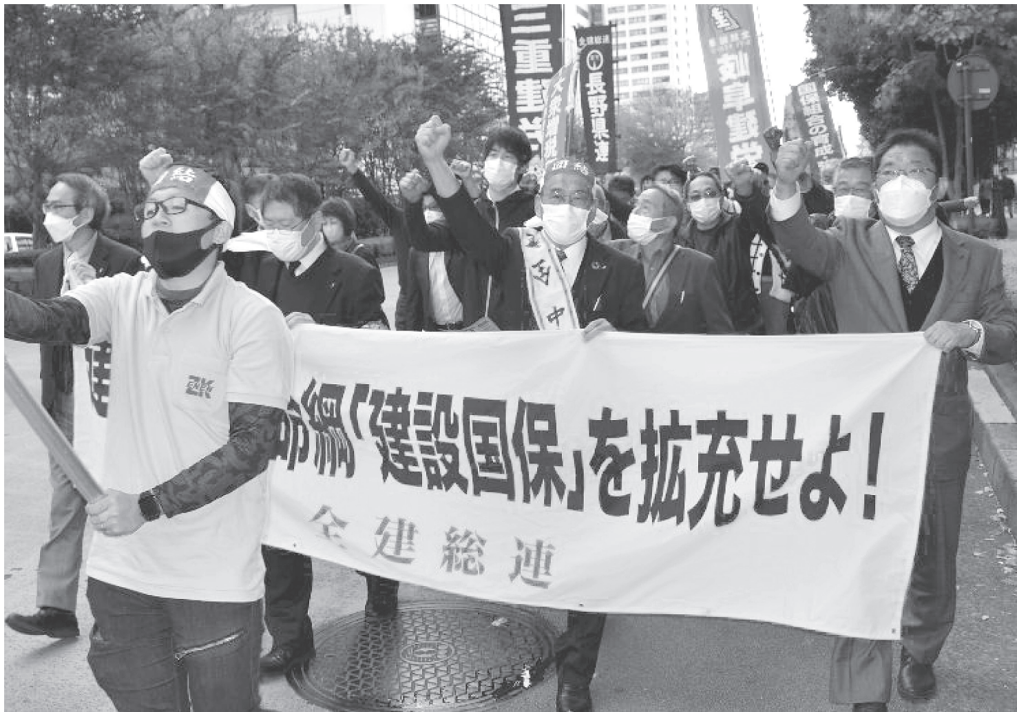
3年ぶりのデモ行進で市民にアピール

大建労本部 TEL 06-6632-2875 FAX 06-6643-5307 求職 06-6647-2587 daikenro@hera.eonet.ne.jp 大建国保本部 TEL 06-6631-7112