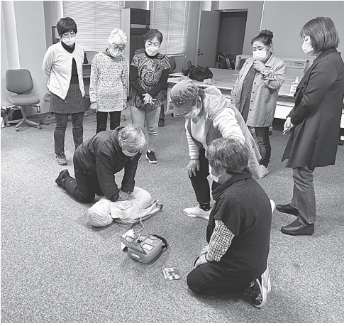
救命蘇生を実習で学ぶ