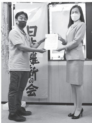
井越東大阪市議に要請書を送る