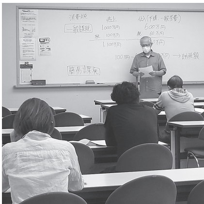
泉佐野支部インボイス説明会