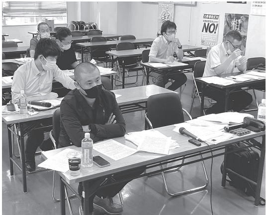
オンラインで組合事務所から企業を追及

十一月六日(日)十時から三年ぶりとなる第五十三回大建労体育祭を行います。会場は扇町公園。ふるってご参加ください。 とき 十一月六日(日)十時～ 扇町公園自由広場 (JR天満駅、大阪メトロ扇町駅下車)