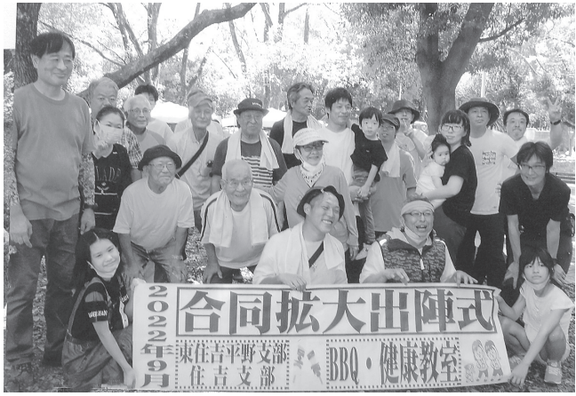
久々に楽しく交流しながら「拡大月間ガンバロウ」