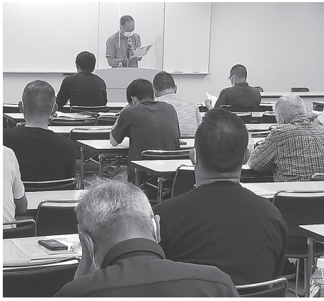
石綿取り扱い作業従事者特別教育 (エルおおさか)

石綿作業特別教育に学ぶ これも組合加入メリット 【泉佐野・深見俊彦・外装工】九月十八日(日)に行なわれた石綿取り扱い作業従事者特別教育に、エルおおさかの定員百人超の会場に受講者三十八人が参加、感涙に満ちた受講会となりました。受講者の中には、健康被害に悩まされている方もおられました。受講者からは、健康被害に悩まされている方もおられました。受講者からは、健康被害に悩まされている方もおられました。