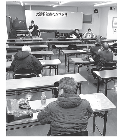
ペンびらきで意見交流