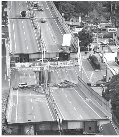
倒壊した阪神高速神戸線