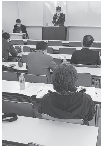
全建総連西税対部長の講演が