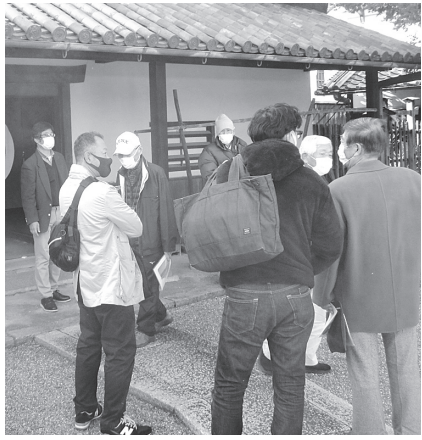
奥田邸を取材する参加者

【堺・後藤藤樹・大工】平野区JR加美駅から徒歩数分、国道二十五号線沿いの古い油屋を改修した「がんご寿司」向かいに「奥田邸が存在する。」と表示されている正面の茅葺の大屋根が目飛び込む。江戸初期に建造された伝統的農家構造で、府下に残る四間間取りの