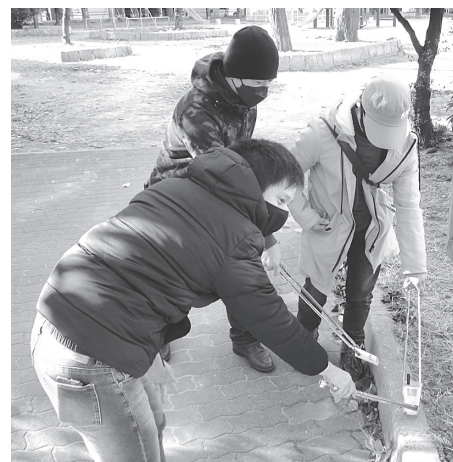
清掃行動に取りくむ青年部員