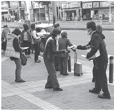
JR天王寺駅前、市民に向け宣伝行動