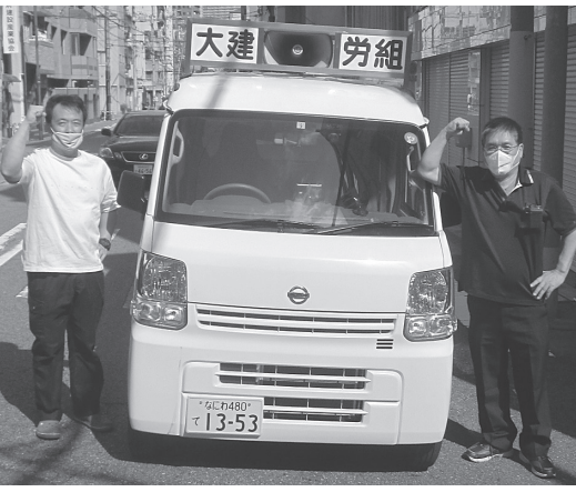
宣伝行動へとび出す仲間

わらあゆる情報提供を行なっていきます。LINEを利用されている方は、使っているスマートフォンでQRコード(上)を読み取ればLINEの友だち追加画面に推