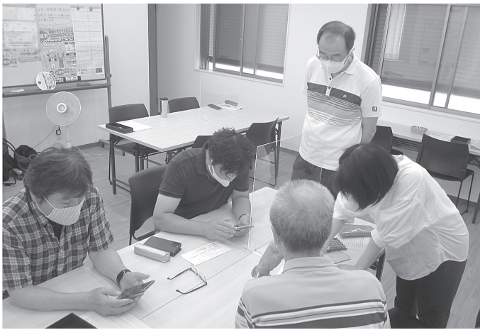
持続化給付金の申請サポート会も開催しました

大阪建設労働組合(だいきんろう)は建設現場で働くみなさんのための組合です。全国で62万人以上、大阪で1万2千人の仲間が加入している、建設労働者のいちご暮らしを守る、一人でも入れる労働組合です。組合員を増やし、地域や自治体への影響力を強めることにより、仕事や暮らしをよくなる制度、政策などを実現することが出来ます。9月・10月は仲間を増やす組織拡大月間に取り組みんでいます。あなたの身近な建設現場で働く組合未加入の方々に、ぜひ「だいきんろう」の存在を伝えてあげてください。ご協力をお願いします。