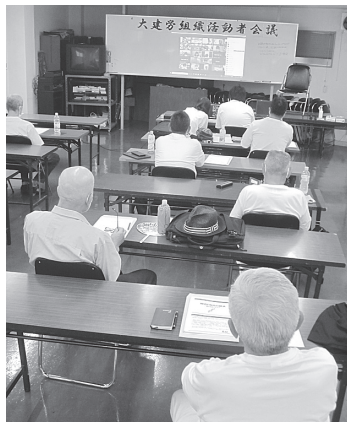
インターネットで仲間をつないで開催

「労働組合ってなあに」に沿って労働組合の歴史、その歴史からなぜ組合が必要なのか、基本的課題から解説。なぜ仲間を増やす必要があるのか。「青年層の拡大が組合を維持し要求実現の保障になること」