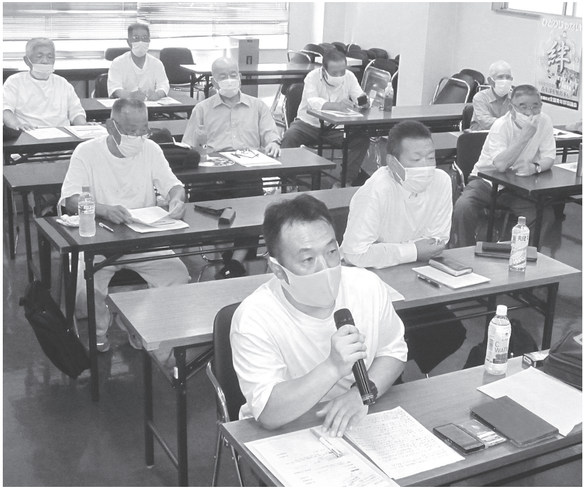
拡大月間での奮闘を訴える栃山組織部長