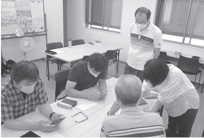
持続化給付金の申請サポート会も開催しました