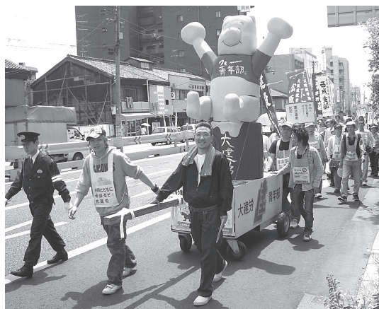
1989年に初開催、93年から続く大建労メーデー

が起源です。十二〜十四時間労働が当たり前だった当時、アメリカの労働者は「第一に」と歌いながらたたかいた、八時間労働制を勝ちとりました。