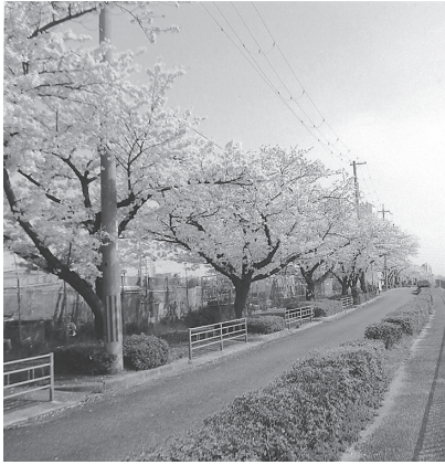
大和川ぞいに咲きほこる桜