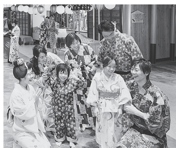
組合員証提示でおトクに

保険料の平準化(統一 化)や財政の均衡(公費 独自繰り入れ廃止)に向 期間 二〇二二年四月一 日〜二〇二四年 四月一日。