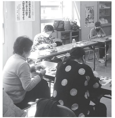
楽しくブローチ作り(主婦の会)

二〇二〇年十二月十五日〜二〇二一年十月三十一日までの期間内に工事請負契約書を締結した一定の省エネ性能を有する住宅の新築(持家・賃貸)、一定のリフォームや既存住宅の購入が対象。申請は四月からの予定となり、発行ポイントは以下のようになります。