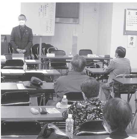
教宣・機関紙活動の大切さ学ぶ