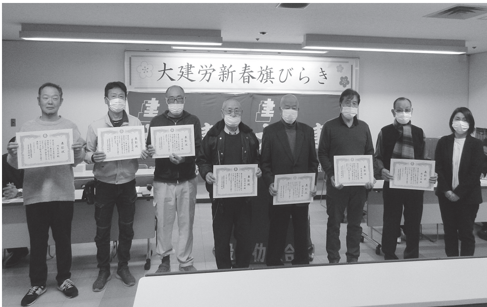
表彰されたみなさん