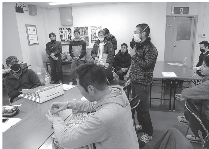
青年部 旗びらきの様子

共済制度は組合員同士の助け合いによって成り立つ給付制度。掛金は月4百円で組合費に含みます。 ■給付内容 ・結婚祝(本人)、出産祝(本人、配偶者)、成人祝(本人)：1万5千円 ・就学祝(子どもの小学校入学時)：1万5千円 ・優待見舞給付 ・火災見舞：5万円 ・風水害見舞：5千円または3万円 ・組合行事での組合事故見舞い給付 ・死亡給付(本人)：3万30万円 ・配偶者・家族死亡給付 ・老齢脱退・脱退給付など ※給付には、事由発生1年以内の申請が必要。脱退・老齢脱退給付除くであり、組合費の完納など条件があります。組合費滞納にご注意を。